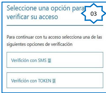
Imagen 3. Luego de esperar, el atacante le solicita a la víctima la verificación de acceso, ya sea en SMS O TOKEN para continuar.

Imagen 2. Al ingresar al sitio web fraudulenta, aparece un mensaje, donde la víctima tiene que esperar porque se está vinculando el dispositivo.