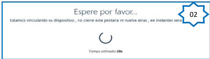
Imagen 2. Al ingresar al sitio web fraudulenta, aparece un mensaje, donde la víctima tiene que esperar porque se está vinculando el dispositivo.

Imagen 1. Sitio web fraudulenta del Banco BBVA, solicita a la víctima el documento de identidad (DNI), el usuario y clave digital para ingresar.