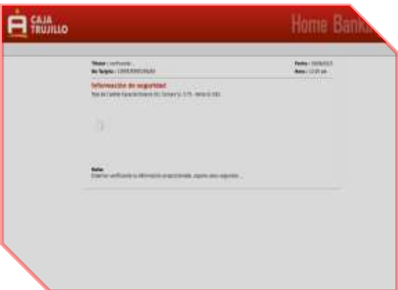
Imagen: 4.- Pasado unos 10 segundos, es redirigido al sitio oficial de la entidad bancaria “Caja Trujillo”, aludiendo un aparente error de autenticación, sin embargo, los datos fueron capturados, por los ciberdelincuentes.

Imagen: 3.- Como paso final aparenta cargar la información proporcionada en los puntos anteriores.