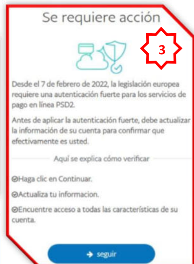
Imagen 03: Una vez ingresado las credenciales de acceso, aparece una nueva ventana, solicitando la actualización de información de la cuenta de la víctima.