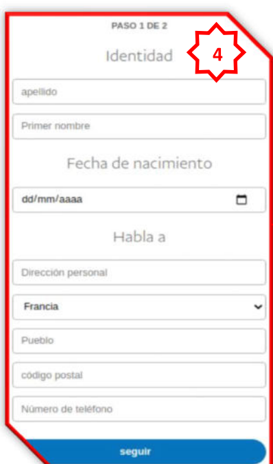
Imagen 04: Después de darle clic en <seguir>, aparece una nueva ventana que requiere los datos personales, dirección, país, código postal y número de teléfono.