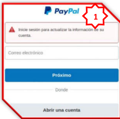
Imagen 01: Sitio web falso de PayPal, solicita a la víctima, ingresar su correo electrónico para actualizar la información de la cuenta.