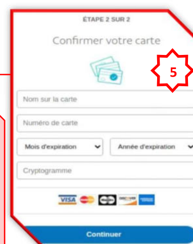
Imagen 05: Luego requiere ingresar el nombre y número de tarjeta, mes y año de expiración, pasado unos segundos indica que has ingresado incorrecto, aludiendo un aparente error de autenticación, sin embargo, los datos fueron capturados por los atacantes.